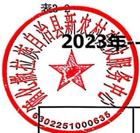
表2-2 2023年--2024年末630225 循化撒拉族自治县本级发行的新增地方政府一般债券资金收支情况表